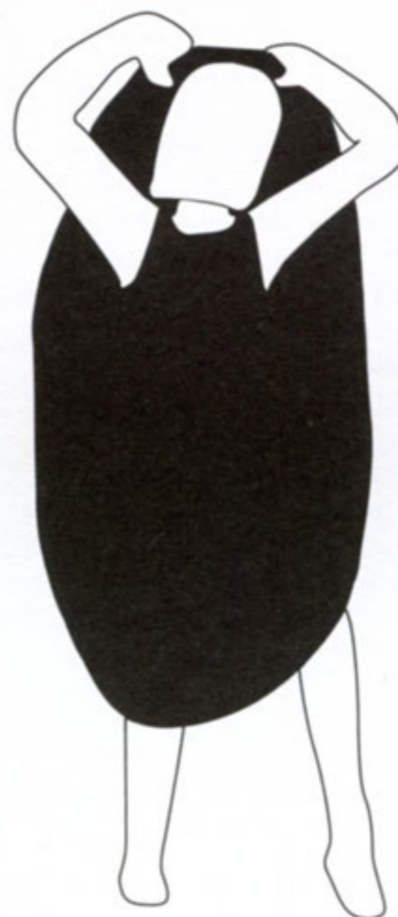
➤ Échantillon des illustrations présentes sur les tee-shirts.