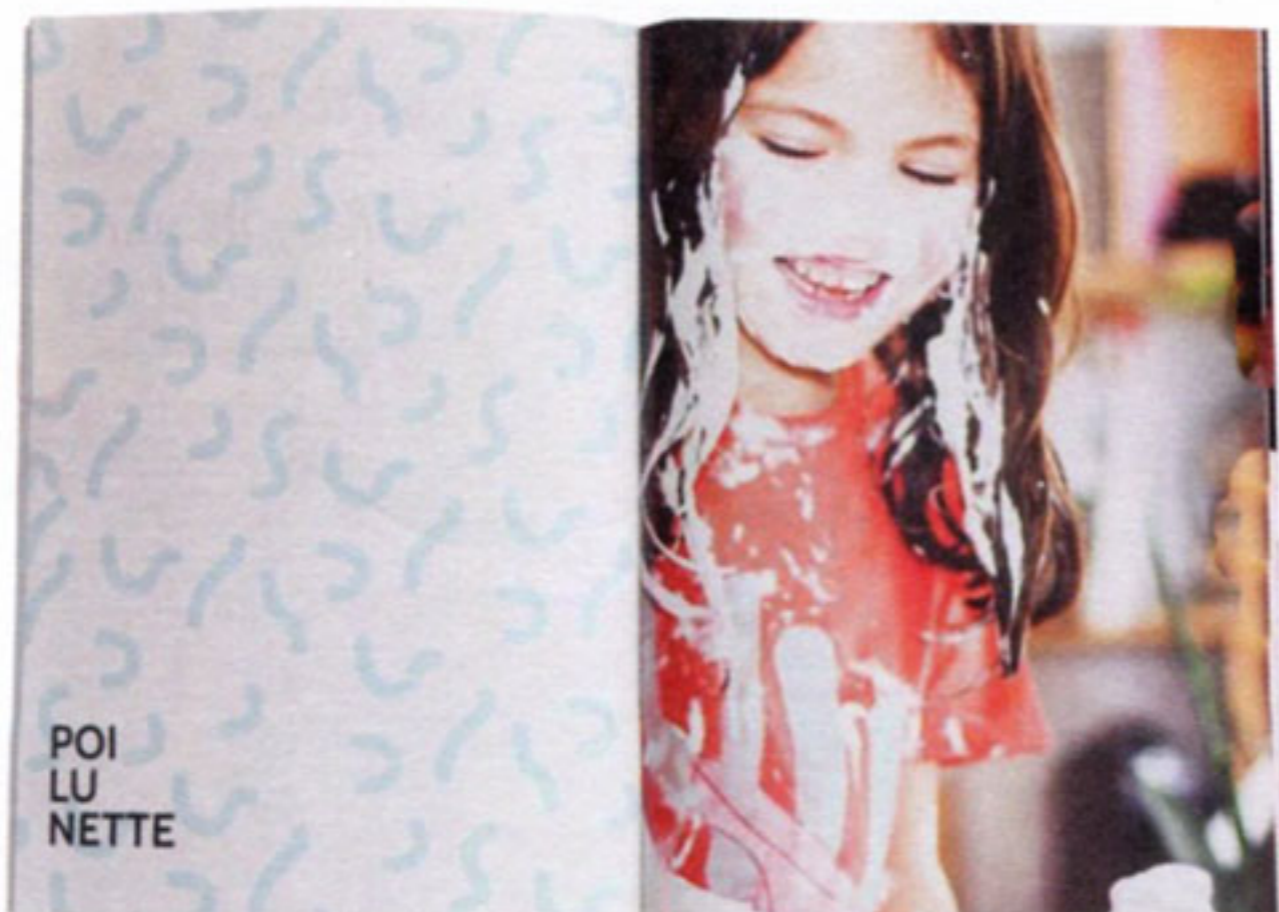
↑ Le look-book et les affiches utilisent la série de photographies ludiques développée par Léa.